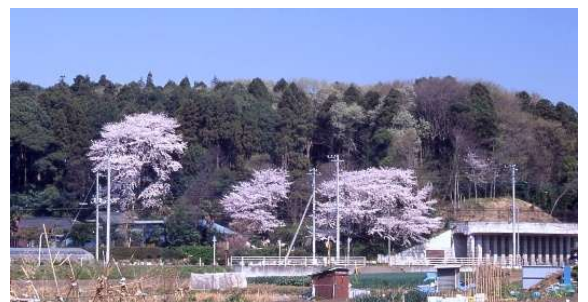
活動場所：根戸城址

開講期間：3月1日(土)から12月まで、毎月3回程度、土曜日(8時30分～12時00分) (都合のよい日だけの参加も可能です)